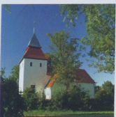
Kościół pw. Wniebowzięcia NMP z XIV w.