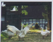
Zagroda bogatego pomorskiego chłopca