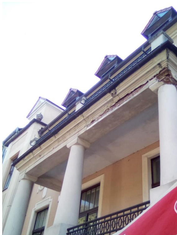
Stan budynku przed remontem

dokumentacji projektowo-kosztorysowej i uzyskaniem niezbędnych decyzji na wykonanie tych prac od strony ul. Sienkiewicza. Zadanie to zostanie ukończone pod koniec 2021 roku.