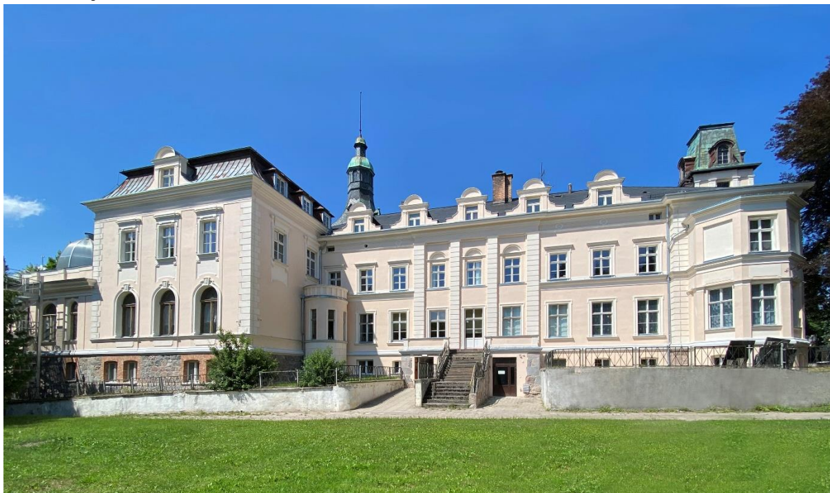
Stan budynku pałacu po remoncie

z dokumentacją projektową” - III etap robót konserwatorsko-budowlanych polegający na rozbiórce i odtworzeniu ścian oraz konstrukcji i pokrycia dachowego mniejszej wieży pałacu w Damnicy, renowację murków okalających budynek oraz nawierzchni zjazdów z kostki kamiennej.