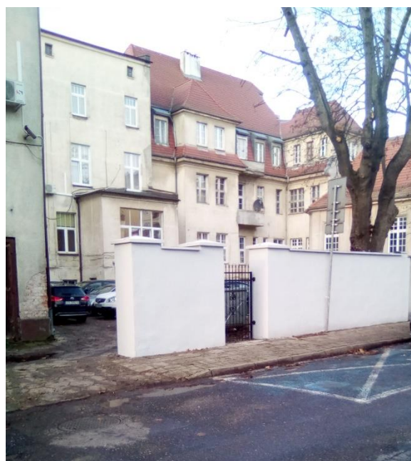
Ogrodzenie przed remontem i po remoncie