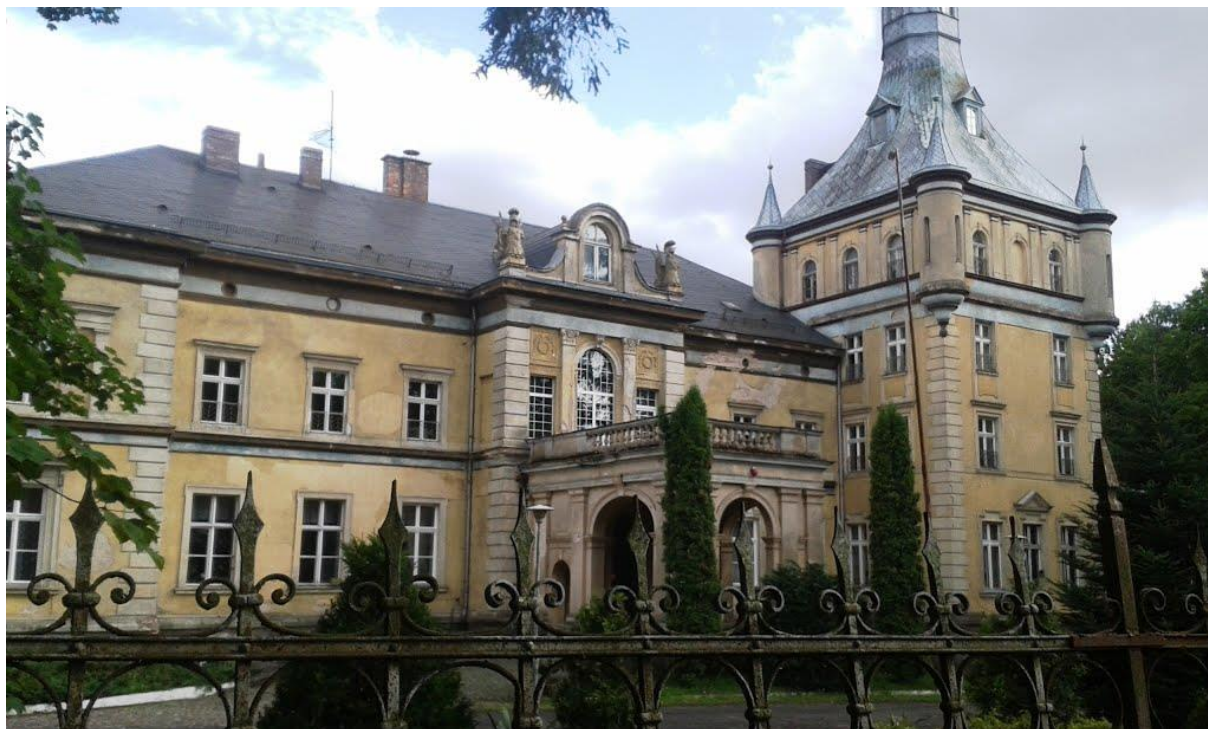
Stan budynku pałacu przed remontem

odprowadzenia wód opadowych, roboty elewacyjne, roboty na terenie przy murach budowli, remont tarasów w elewacji frontowej (północnej) i tylnej (południowej). Pomorski Wojewódzki Konserwator Zabytków przyznał dotację w wysokości 16 tysięcy złotych na wykonanie ww. dokumentacji. Kwota ta wystarczyła na pokrycie 41,96 proc. jej kosztów. Pozostałe środki w wysokości 22 130,00 zł na jej opracowanie pochodziły z budżetu powiatu.