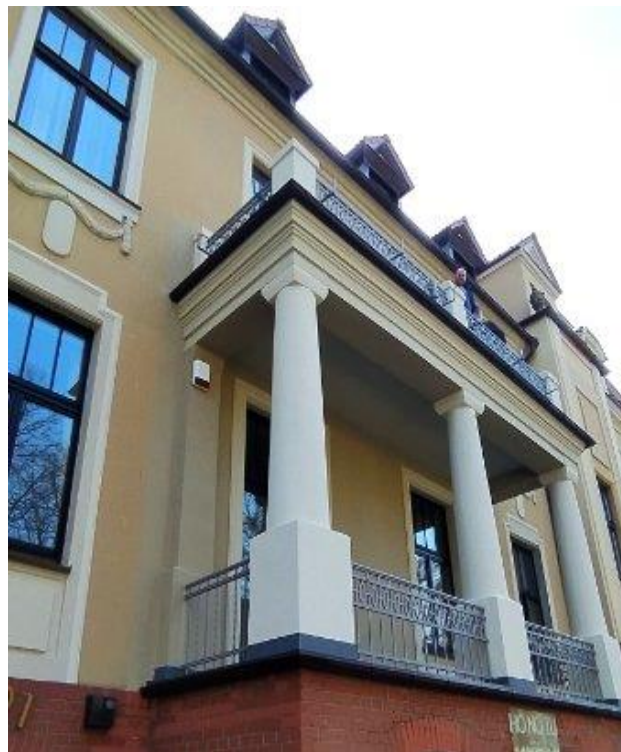
Stan budynku po remoncie

Wykonano odbudowę ogrodzenia przy ul. Murarskiej z wykorzystaniem istniejącej bramy wjazdowej i furtki, wykonano ekspertyzę dendrologiczną 2 drzew zlokalizowanych na terenie siedziby PCPR oraz prowadzono prace pielęgnacyjne koron tych drzew.