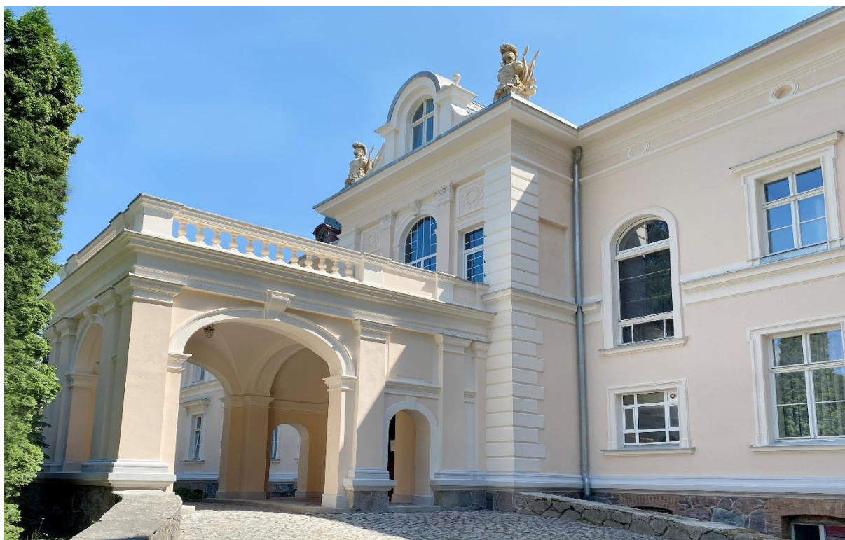
Stan budynku pałacu po remoncie

W 2020 roku poniesiono wydatek łącznie na kwotę 936 253,14 zł na wykonanie robót budowlanych (etap II) – 898 577,15 zł (w tym środki Rządowego Funduszu Inwestycji Lokalnych w kwocie 75 587,00 zł.), nadzoru inwestorskiego – 13 776,00 zł, dokumentacji projektowej wymiany pokrycia dachowego wieży budynku oraz naprawy muru oporowego i nawierzchni kamiennej – 23 899,99 zł. Równolegle realizowane były prace w ramach dostosowania budynku do wymogów ppoż. wynikające z decyzji Komendanta Wojewódzkiego Państwowej Straży Pożarnej w Gdańsku nr WZ.5595.217.3.2016.BG z 8 września 2016 roku. Obejmowały one m.in. zbudowanie dodatkowych schodów zewnętrznych na II piętro, umożliwiających szybką ewakuację przebywających w nim wychowanków oraz specjalnego ogniodpornego tunelu na poddaszu umożliwiającego szybką i bezpieczną ewakuację. Całkowita wartość zadania wyniosła 1 290 371,75 zł.