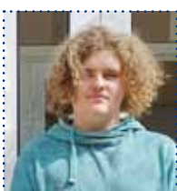
JANEK III klasa technikum mechatronik

- To super szkoła, w której panuje przyjazna atmosfera! Trzymamy się razem na przerwach, imprezach, zawodach i na zagranicznych stażach. Nauki jest dużo, ale nauczyciele nam pomagają.