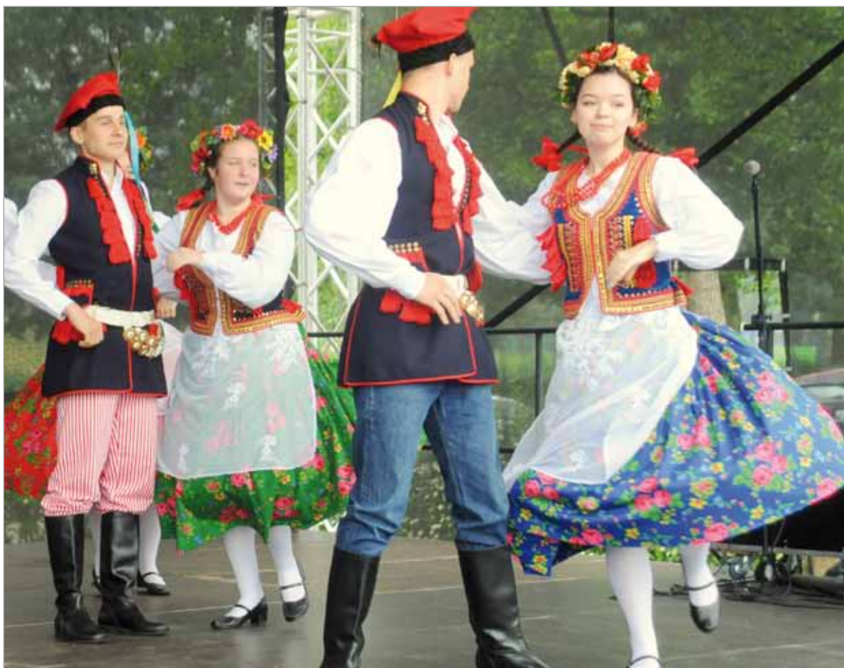
Tak bawiono się na festiwalu w ubiegłych latach.

W tym roku dzięki dofinansowaniu w wysokości 42 tysięcy złotych laureaci dwóch konkursów organizowanych w ramach festiwalu – przeglądu kapel i zespołów ludowych oraz konkursu plastycznego „Życie na wsi” – mogą liczyć na atrakcyjne nagrody. Regulamin i karty zgłoszeniowe dla osób zainteresowanych udziałem w konkursach będą dostępne na stronie kultura.powiatyslupsk.pl . Z organizatorami można się również skontaktować telefonicznie (59 844 57 58) lub drogą mailową: impresariat@kultura.powiatyslupsk.pl