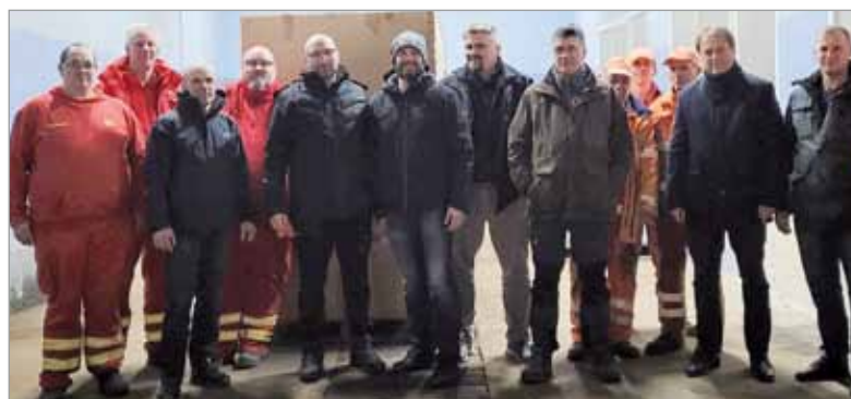
Z partnerami z niemieckiego powiatu Herzogtum Lauenburg, którzy przywieźli dary do Słupska.

- Cały czas jesteśmy w kontakcie z naszymi partnerami z rejonu - powiatu różyszczeńskiego, z którymi od dawna utrzymywaliśmy ożywione kontakty dwustronne. Staramy się na bieżąco, w miarę naszych możliwości, reagować na zgłaszane przez nich potrzeby. Nie chcemy działać po omacku. Zależy nam na tym, by pomoc, jaką przekazujemy, możliwie najbardziej odpowiadała aktualnym potrzebom Ukraińców. Współpracujemy w tym zakresie z naszymi partnerami zagranicznymi z powiatu Herzogtum Lauenburg, dla których jesteśmy pomostem w kontakcie z Ukrainą.