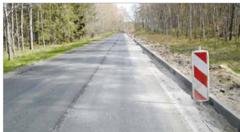
Przebudowa drogi do Smołdzina.