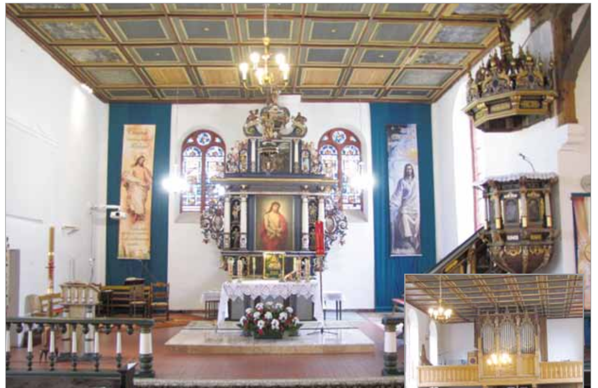
Wnętrze kościoła św. Trójcy.

Zdobiące strop obrazy – uznawane za cenne zabytki sztuki chrześcijańskiej na obszarze powiatu słupskiego – namalowano około 1632 r. Obecnie jest to 49 obrazów w kasetonowej oprawie, chociaż pierwotnie było ich aż 150. Ich autorstwo przypisuje się przynajmniej dwóm malarzom – Lickfotowi i Foxkirchowi. Tematyka malowideł nawiązuje do wydarzeń z życia Jezusa i przypowieści z Nowego Testamentu oraz przedstawia postacie z Nowego Testamentu. Odrębny temat stanowią obrazy i figury przedstawiające proroków, ewangelistów i pojedyncze wizerunki Chrystusa i świętych. Znajdująca się w kościele chrzcielnica uważana jest z kolei za najciekawsze dzieło snycerskie w naszym regionie. Pierwotnie na chrzcielnicy umieszczone były inskrypcje związane z sakramentem chrztu. Były to cytaty ze Starego i Nowego Testamentu – Księgi Zachariasza, Księgi Izajasza, Księgi Ozeasza i Ewangelie św. Jana, św. Marka i św. Mateusza. Wersety znajdowały się w płycinach, siedem pisanych w języku niemieckim – gotykiem i jedną antykwą po łacinie. Treść wersetów eksponowała ważność chrztu. Nieodpowiedzialna konserwacja zamalowała płycinę i zmieniła pierwotny wygląd chrzcielnicy, która posiada kształt kielicha z osmioboczną czaszą. Pierwotnie zamykała ją rozbudowana pokrywa, którą wieńczyła postać Chrystusa błogosławiącego dzieci. Obecnie zachowała się z niej grupa figuralna tworząca lampkę wieczną. Czaszą