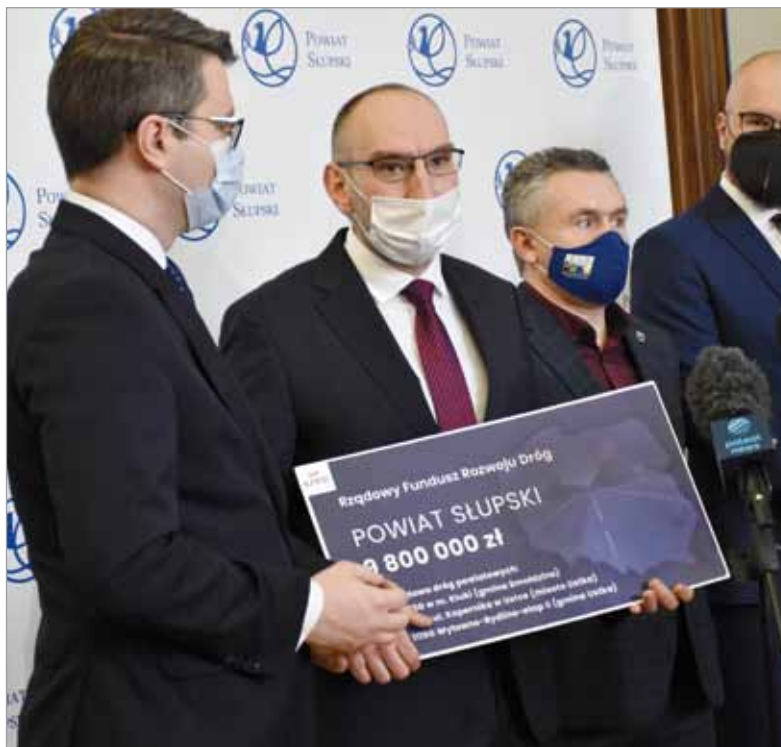
Decyzję o przyznaniu pieniędzy z Rządowego Funduszu Rozwoju Dróg ogłosił w lutym w Starostwie Powiatowym w Słupsku poseł Piotr Müller.

Ostatnią z inwestycji, realizowanych przy udziale pieniędzy z tegorocznej edycji Rządowego Funduszu Rozwoju Dróg, jest przebudowa drogi w Klukach w gminie Smołdzino, która ma kosztować około czterech milionów złotych. Jej finansowanie wygląda podobnie jak dwóch pozostałych, czyli połowa kwoty to fundusze rządowe, a po jednej czwartej pochodzi z budżetów samorządów powiatowego i gminnego. Zakres prac budowlanych obejmuje m.in. poszerzenie drogi prowadzącej do skansenu Muzeum Wsi Słowińskiej do 5,5 m, ułożenie kamiennej nawierzchni, nawiązującej do historycznego charakteru zabudowy tej miejscowości oraz budowę chodnika. Nowa droga ma zostać zaprojektowana w taki sposób, by uspokoić na niej ruch drogowy, co ma przyczynić się do poprawy bezpieczeństwa.