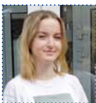
WIKTORIA I klasa liceum piłka ręczna

- Uczymy się w nowoczesnej dużej i zadbanej szkole z halą sportową, na której organizowane są liczne imprezy sportowe. To szkoła, do której chodzę z przyjemnością i bez stresu.