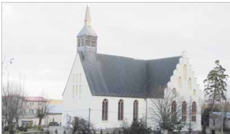
Smołdziński kościół na tle wsi.

pierwotnie miejscem kultu pomorskich Słowian. Na południowo-wschodnim zboczu Rowokołu odkryto pozostałości kolistych wałów z IX-XI wieku z wielkim paleniskiem ofiarnym i szczątkami kości zwierzęcych. Na przełomie XII i XIII wieku na Rowokole wzniesiono kaplicę poświęconą św. Mikołajowi - patronowi żeglarzy. Do czasów reformacji Rowokół, obok Góry Chelmskiej w Koszalinie i Świętej Góry w Polanowie, był jednym z ważniejszych ośrodków kultu religijnego na Pomorzu Zachodnim, któremu kres położyło wprowadzenie na Pomorze nauki Marcina Lutra. Smołdzino to obecnie siedziba Urzędu Gminy, dyrekcji Słowińskiego Parku Narodowego oraz duża szkoła i ośrodek kultury. To węzeł komunikacyjny dojazdu na szlaki turystyczne SPN i do wydm ruchomych oraz latarni morskiej w Czolpinie, do skansenu Słowinów w Klukach. Stąd też księżna Anny de Croy, często udawała się ze Smołdzina na letni wypoczynek nad morze.