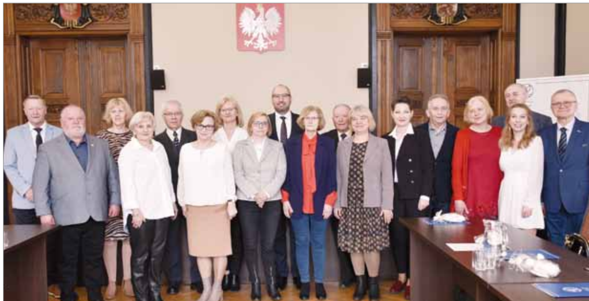
W skład Powiatowej Rady Seniorów wchodzi reprezentanci poszczególnych gmin powiatu.

Powiatowa Rada Seniorów to organ doradczy. Jej działania pozwolą lepiej poznać potrzeby starszych mieszkańców i wzmocnić ich udział w życiu społeczności powiatu słupskiego. Jej członkowie będą nie tylko doradzać władzom powiatu i opiniować projekty aktów prawa miejscowego,