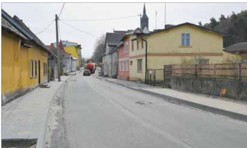
Przebudowa drogi Gardna Wielka - Smołdzino.

Inwestycja ta warta jest ponad 9,6 mln zł. Finansowana jest z pieniędzy z Rządowego Funduszu Rozwoju Dróg, jakie w kwocie 4,6 mln zł, pozyskali urzędnicy starostwa oraz z budżetu powiatu i gminy Środowiska i Gospodarki Wodnej.