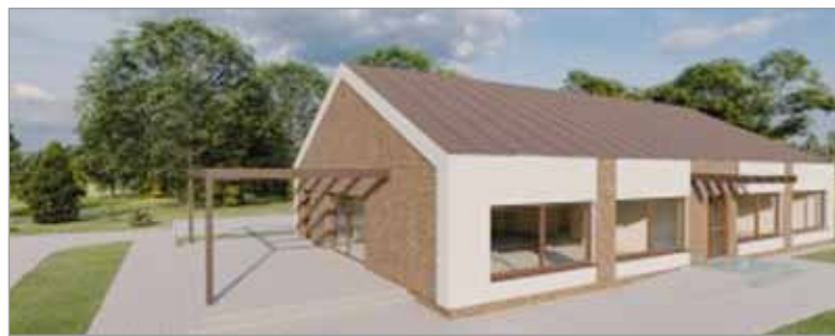
Tak ma wyglądać Lokalne Centrum Kultury w Bobrownikach.

trami aktywizującymi lokalną społeczność. Obie inwestycje realizuje słupska firma Sima. Ich łączny koszt to 2,7 mln zł, z czego 1,8 to dofinansowanie, jakie gmina otrzymała z Rządowego Funduszu Inwestycji Lokalnych.