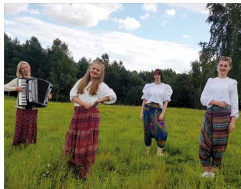
Gwiazdą festiwalu będzie zespół Lunove.