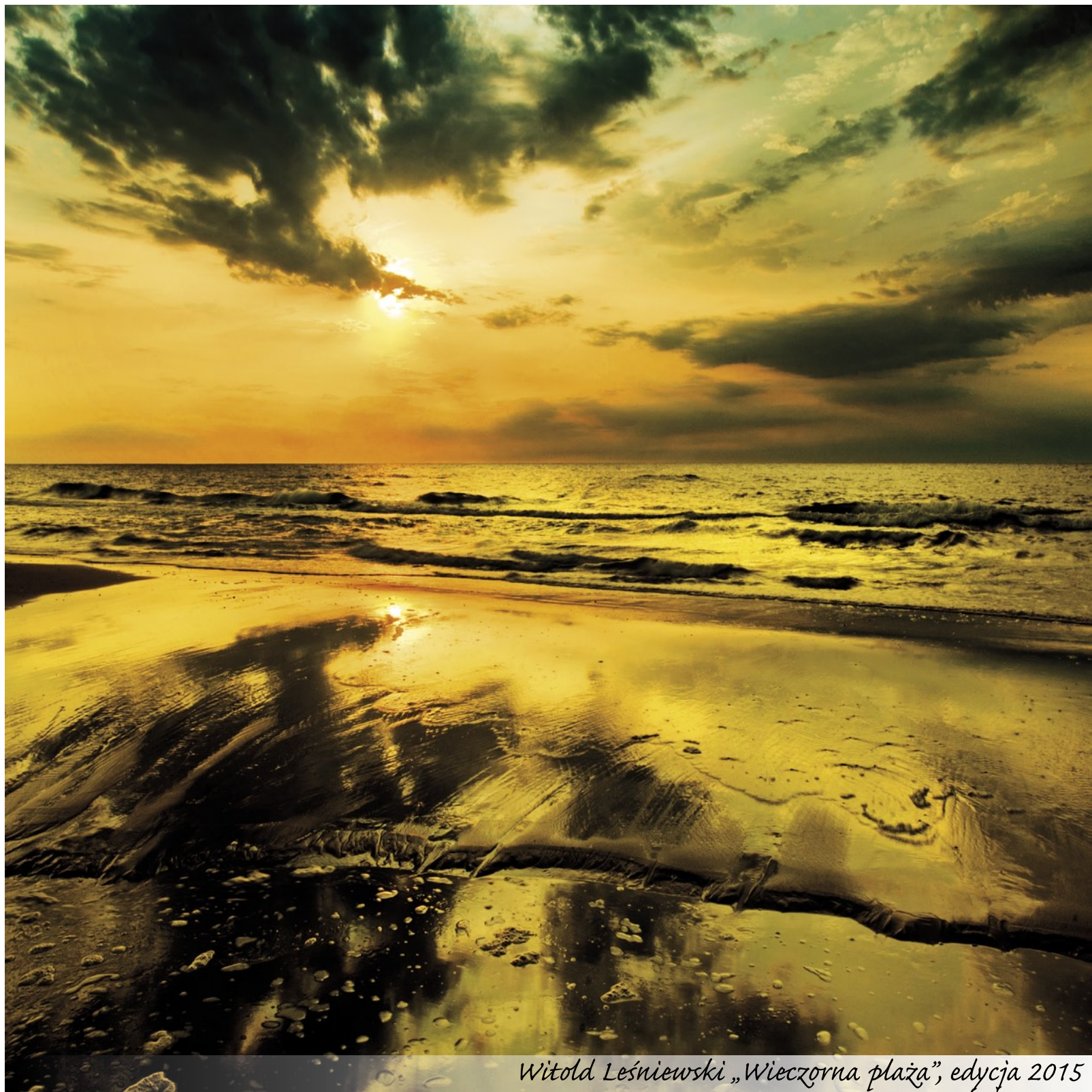
Witold Leśniewski „Wieczorna plaża”, edycja 2015