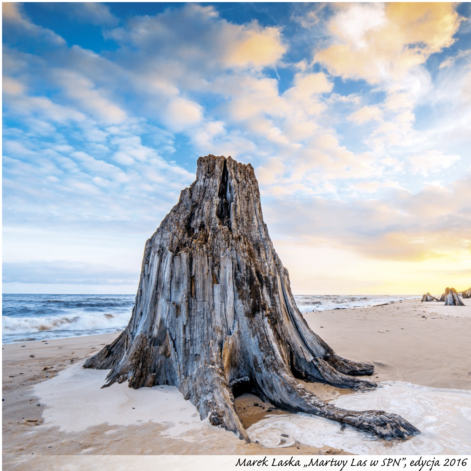
Marek Łaska „Martwy Las w SPN”, edycja 2016