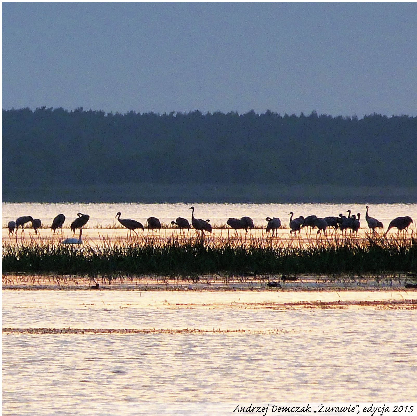
Andrzej Demczak „Żurawie”, edycja 2015