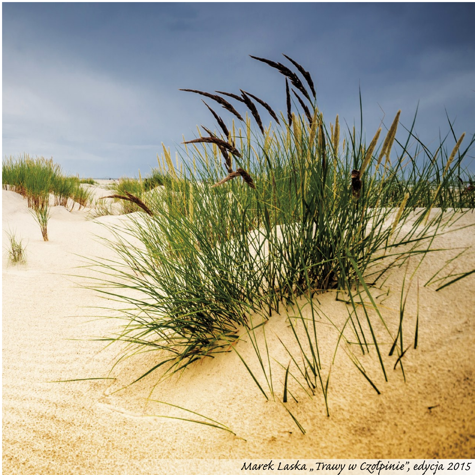
Marek Laska „Trawy w Czotpinie”, edycja 2015