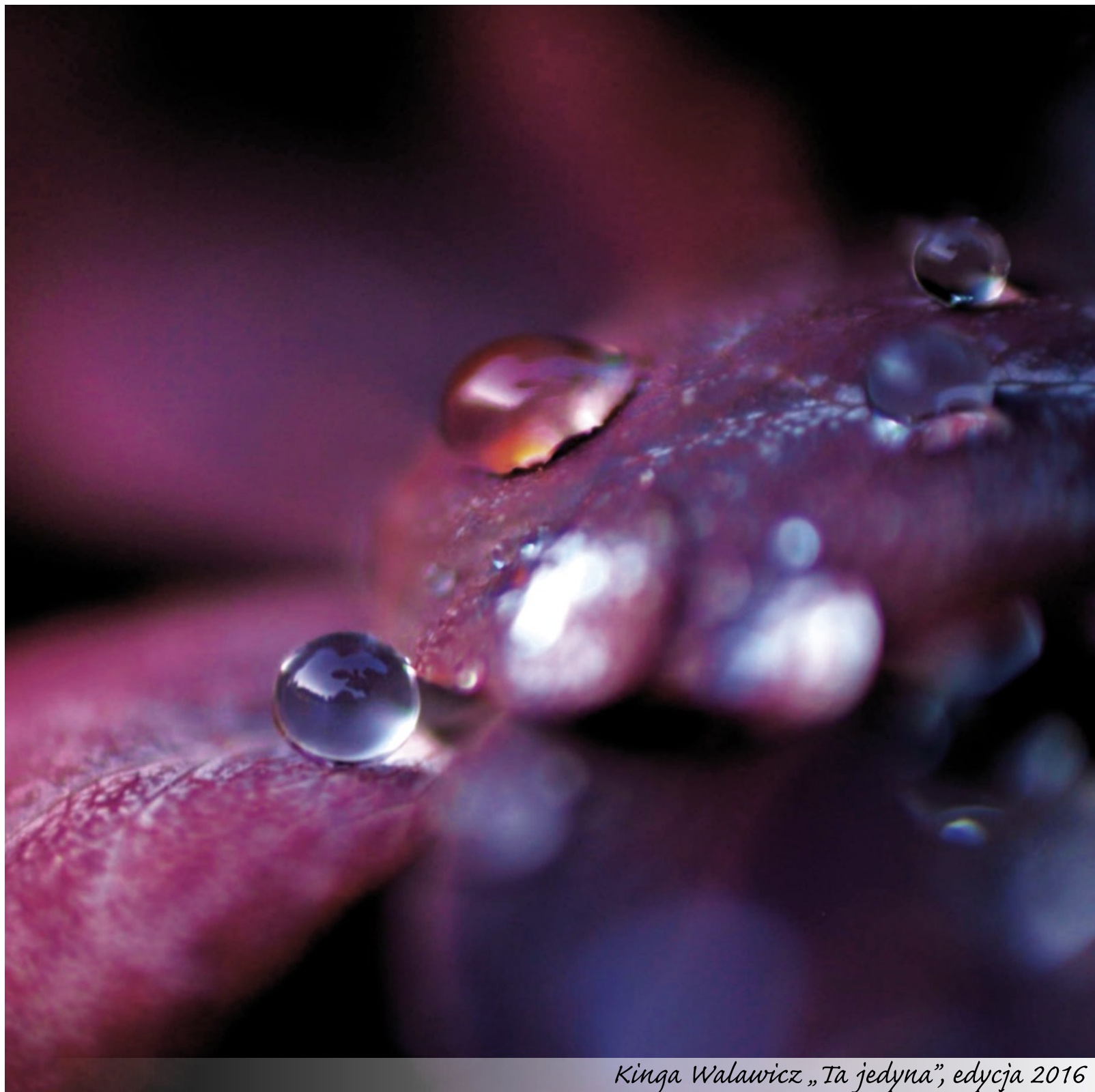
Kinga Walawicz „Ta jedyna”, edycja 2016