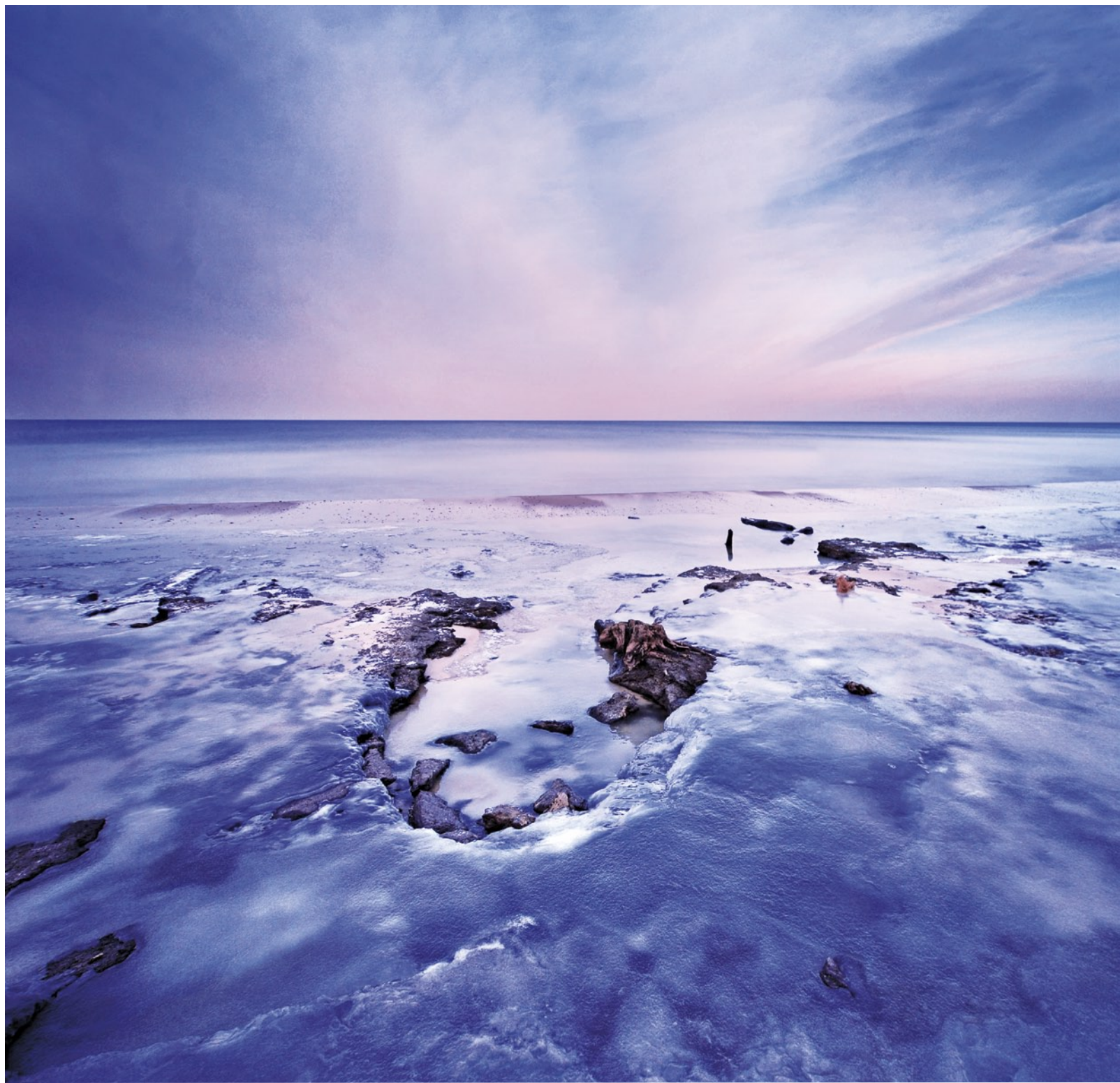
Witold Leśniewski „Zimowy brzask”, edycja 2016