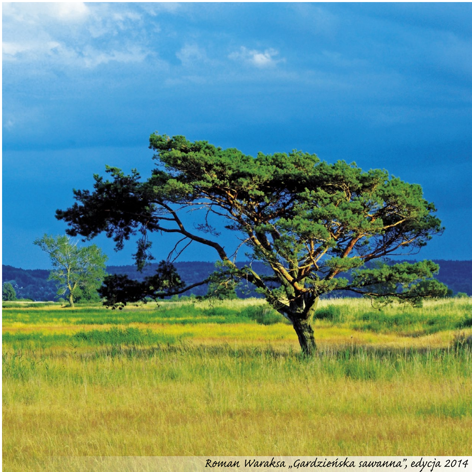
Roman Waraksa „Gardzieńska sawanna”, edycja 2014