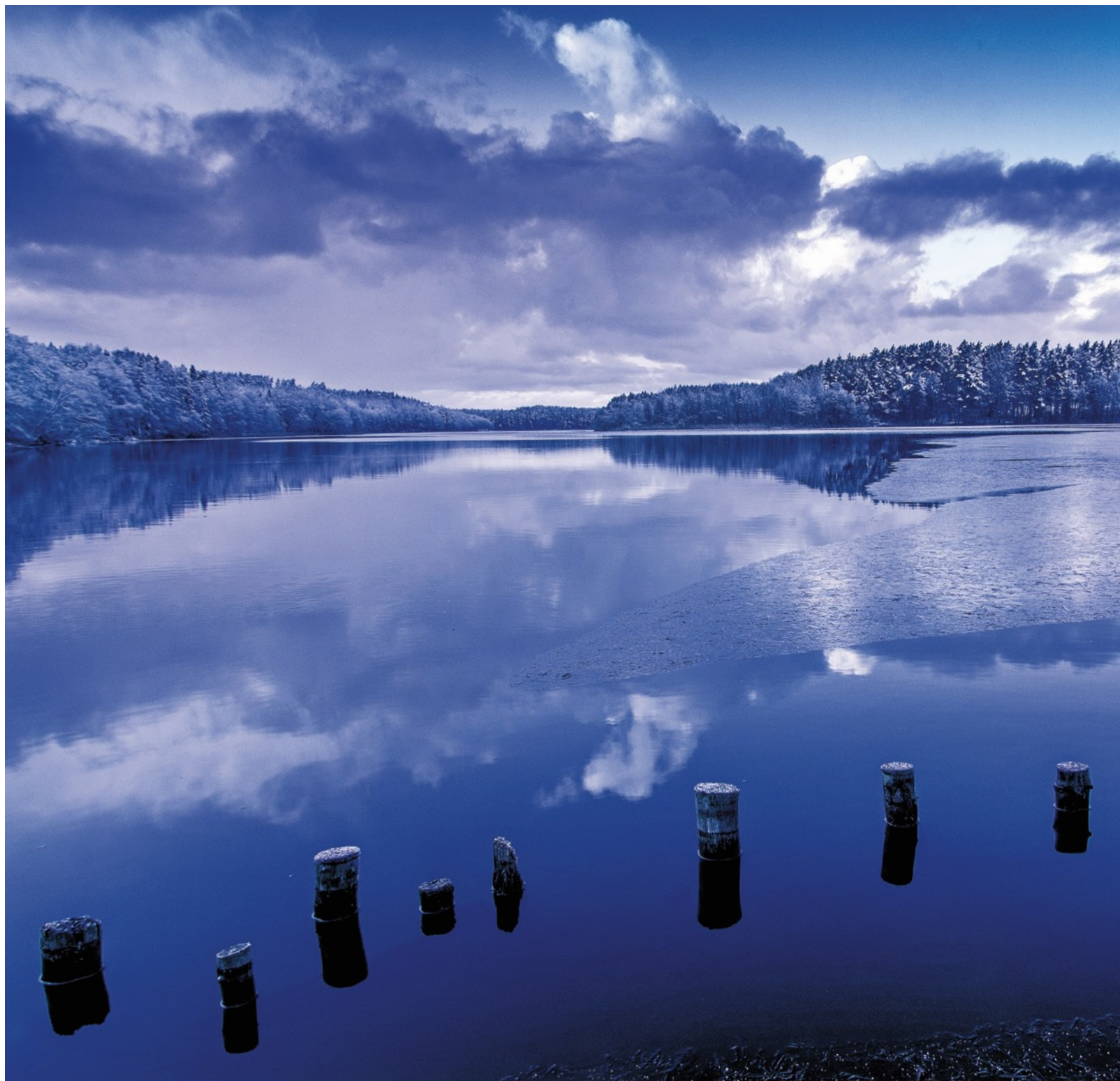
Witold Leśniewski „Papieski szlak kajakowy zimą”, edycja 2016