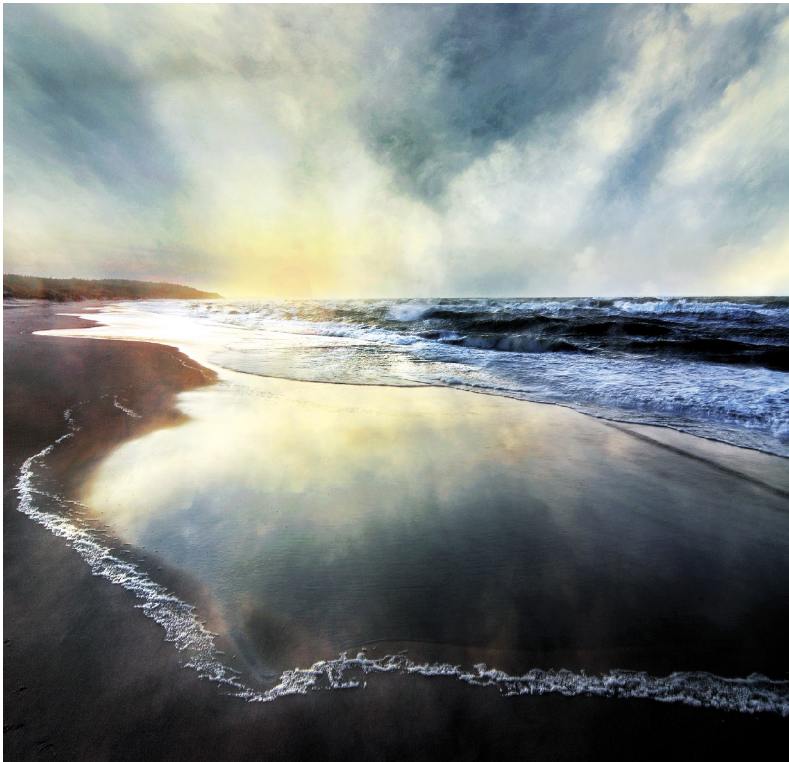
Witold Leśniewski „Sztormowy poranek”, edycja 2016