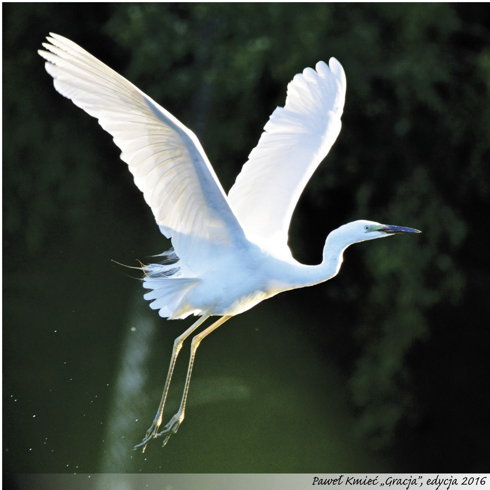
Paweł Kmiec „Gracja”, edycja 2016