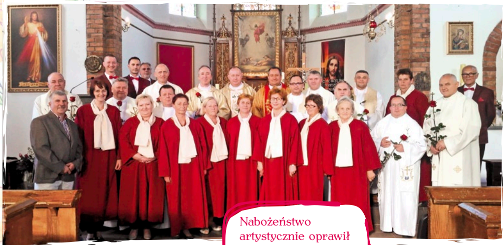
Nabożeństwo artystycznie oprawił Chór Epifania z Wrześcia.