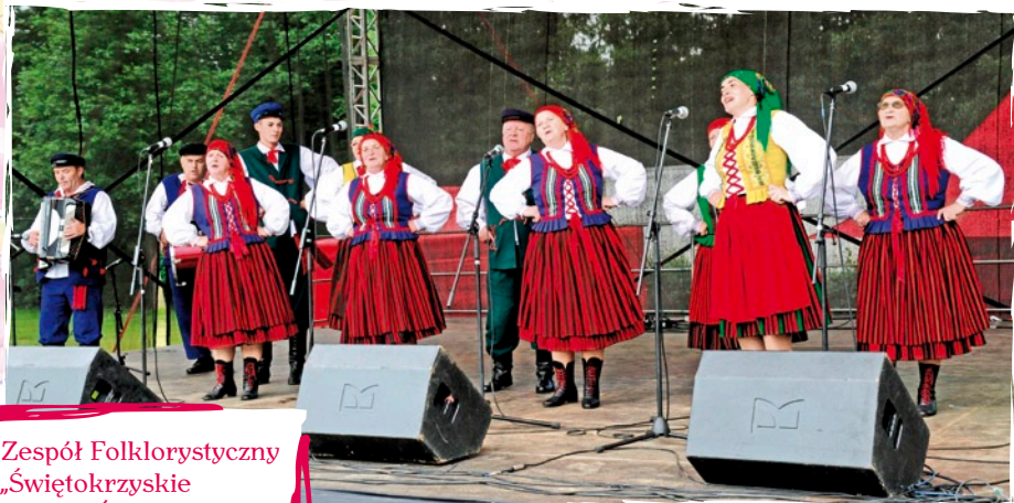
Zespół Folklorystyczny „Świętokrzyskie Jodły” - Śniadka, powiat kielecki, woj. świętokrzyskie.