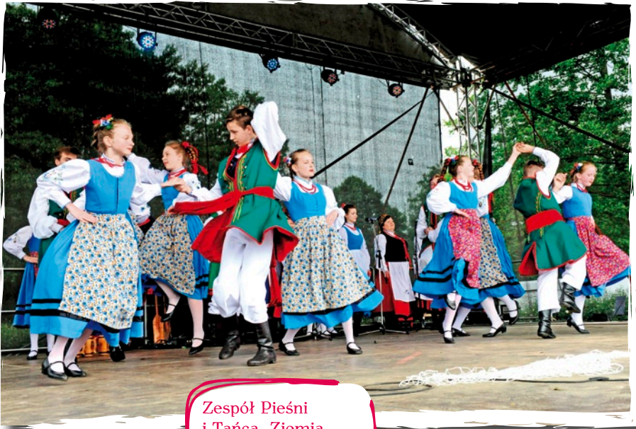
Zespół Pieśni i Tańca „Ziemia Lęborska” - Lębork.