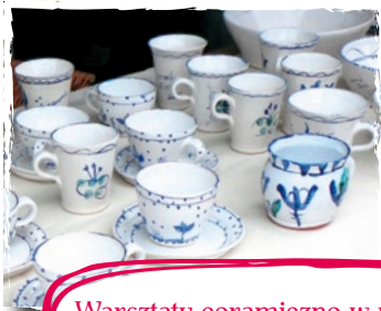
Warsztaty ceramiczne w wykonaniu Pracowni Ceramicznej Słupskiego Ośrodka Kultury w Słupsku.