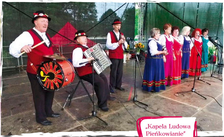
„Kapela Ludowa Pieńkowanie” - Postomino.