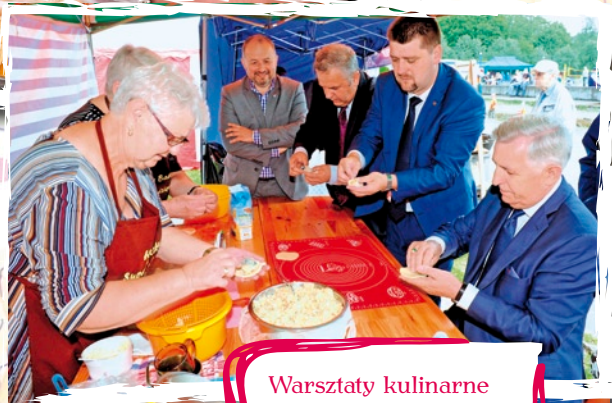
Warsztaty kulinarne prowadzone przez Koło Gospodyń Wiejskich z Redzikowa.