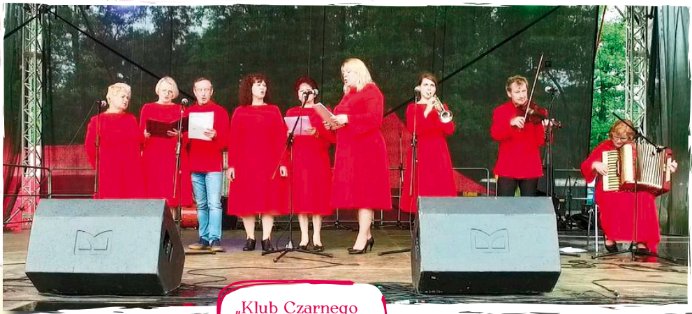
„Klub Czarnego Krążka” - Słupsk.