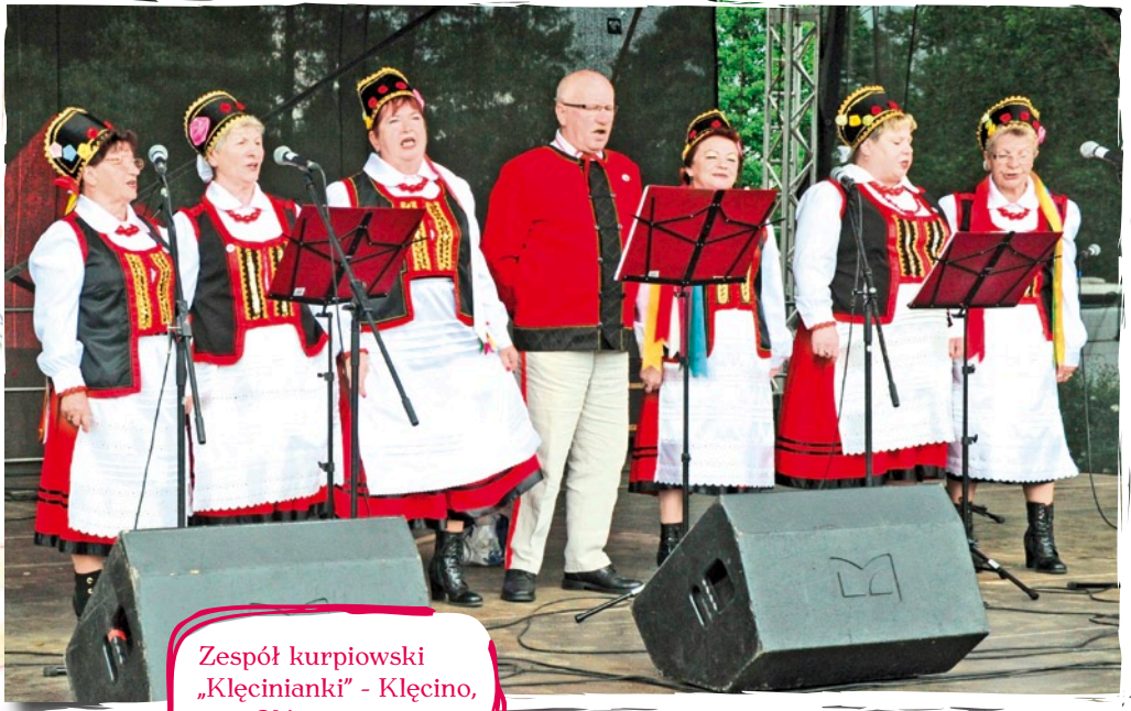
Zespół kurpiowski „Klęcianki” - Klęcino, gm. Główczyce.