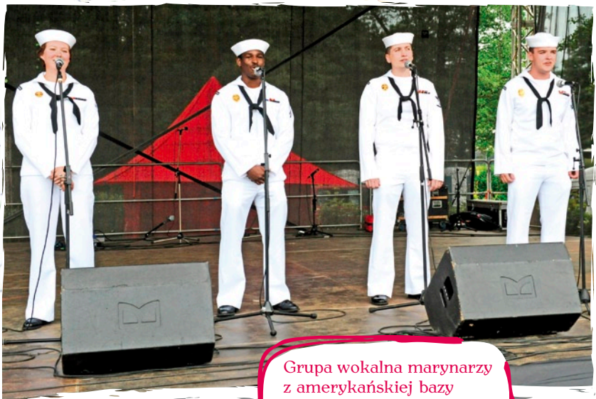
Grupa wokalna marynarzy z amerykańskiej bazy wojskowej w Redzikowie (poza konkursem).