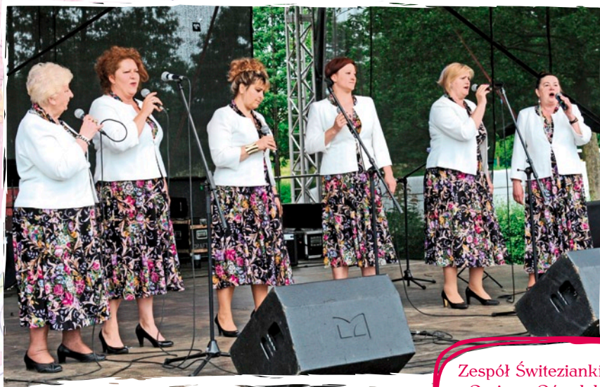
Zespół Świtezianki - Gminny Ośrodek Kultury Gminy Słupsk w Głobinie (poza konkursem).