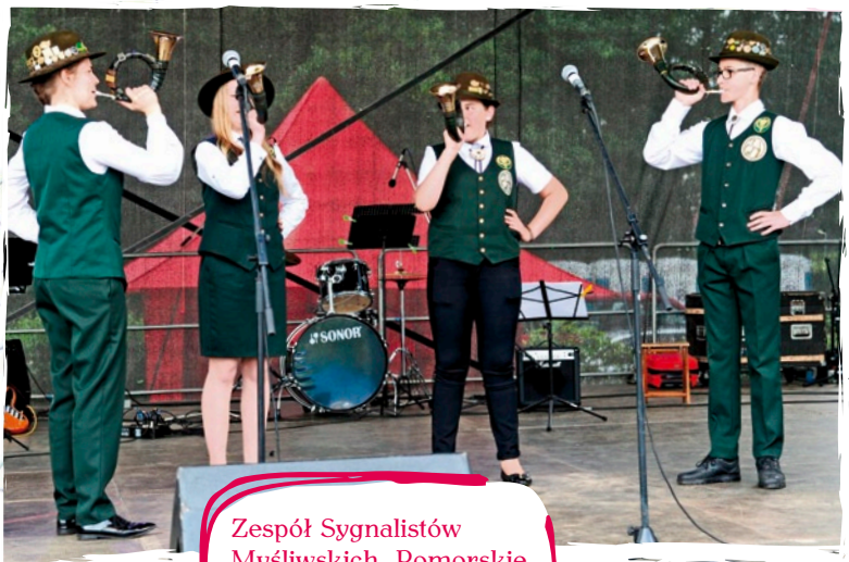
Zespół Sygnalistów Myśliwskich „Pomorskie Rogi” - Bytów (poza konkursem).