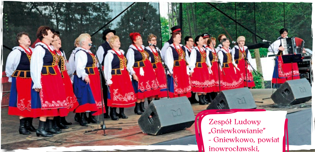
Zespół Ludowy „Gniewkowanie” - Gniewkowo, powiat inowrocławski, woj. kujawsko- pomorskie.