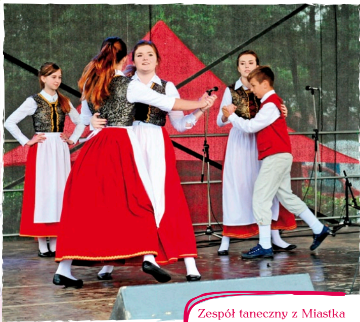
Zespół taneczny z Miastka „Rummelsburger Tanz Gruppe” (poza konkursem).