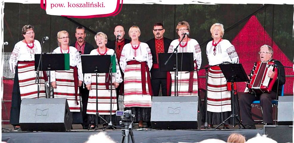
Ludowy Zespół Śpiewaczy „Ballada” - Mścice, pow. koszaliński.