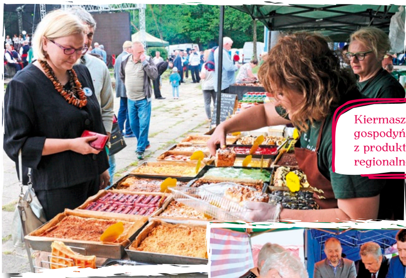
Kiermasz kół gospodyń wiejskich z produktami kuchni regionalnej.