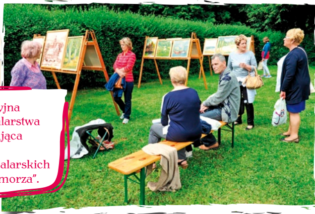
Retrospekcyjna wystawa malarstwa podsumowująca dwadzieścia plenerów malarskich „Pejzaże Pomorza”.