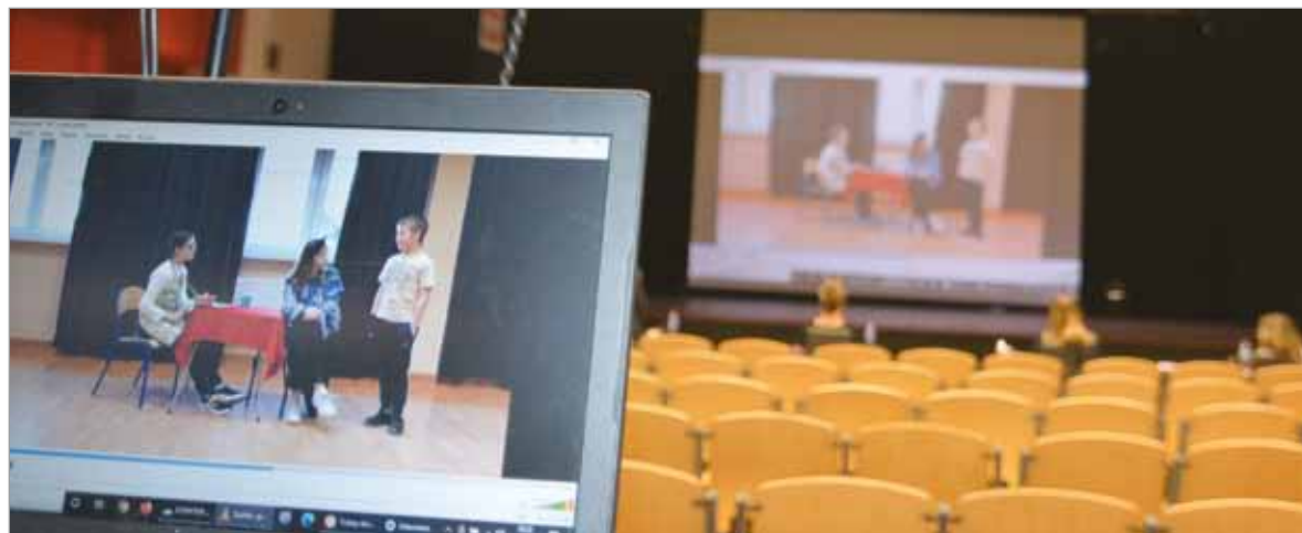
Jury konkursu nadesłane filmy oglądało z zachowaniem zasad bezpieczeństwa epidemicznego.

i dzieci. Pierwsze miejsce w gronie dorosłych zajęła wspomniana „Wizja” z Machowina, drugie grupa „Epitetem po metaforze” z Domu Pomocy Społecznej w Lubuczewie, a trzecie grupa „Poczytalni” z Biblioteki – Gminnego Centrum Kultury w Trzebielinie. W kategorii dziecięcej wyróżnienie otrzymał Kabaret Szpilka z Powiatowego Młodzieżowego Domu Kultury w Miastku.