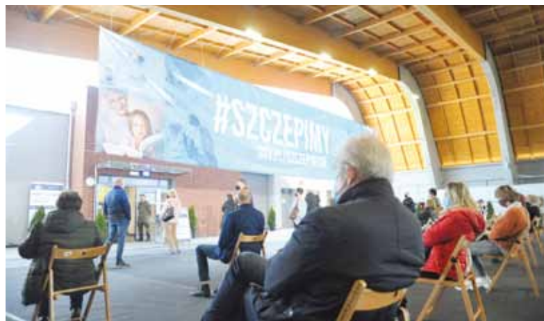
Tylko pierwszego dnia w Redzikowie zaszczepiono ponad 320 osób.