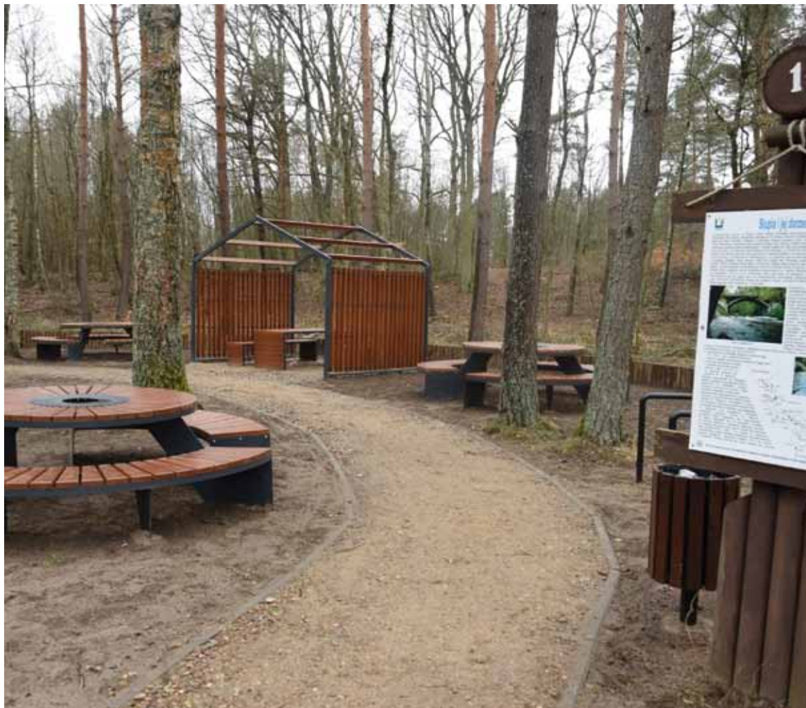
Nowe stacje pozwolą na rozwój turystyki rowerowej w gminie Kobylnica.

Budowa nowych stanic rowerowych kosztowała ponad 360 tys. złotych. Zdecydowaną większość tej kwoty – 270 tys. zł władze gminy zdobyły z funduszy unijnych – z Regionalnego Programu Operacyjnego Województwa Pomorskiego. Budowa miejsc wypoczynku dla rowerzystów jest częścią realizowanego przez gminę Kobylnica, wspólnie z partnerami projektu, „Ochrona różnorodności biologicznej na terenie powiatu słupskiego”.