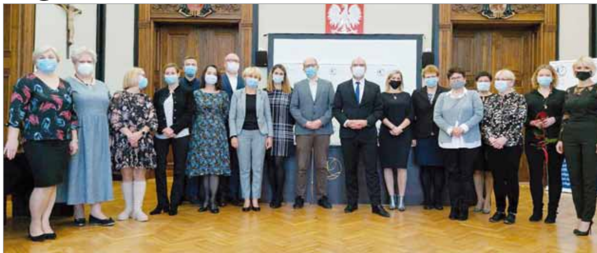
Z wyróżnionymi nauczycielami władze powiatu spotkały się w Starostwie Powiatowym.