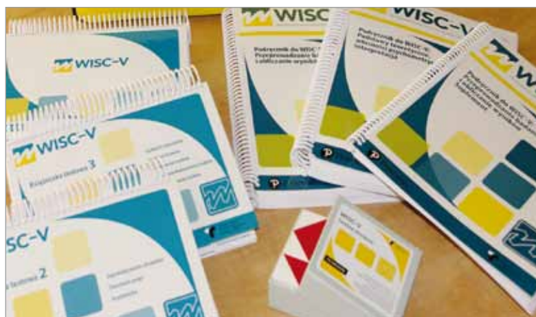
Testy diagnostyczne służą do badania dzieci od sześciu do szesnastu lat.

Wszechstronna diagnoza dzieci i młodzieży jest jednym z głównych zadań poradni psychologiczno-pedagogicznej. Przeprowadza ją psycholog, a jego badania uzupełniane są – w razie potrzeby – badaniami innych specjalistów: pedagogów, logopedów, doradców zawodowych, fizjoterapeutów czy terapeutów integracji sensorycznej. Badanie psychologiczne ma na celu poznanie dziecka, jego możliwości rozwoju, zachowań, specyfiki trudności w funkcjonowaniu szkolnym, osobniczym, w relacjach rodzinnych, czy rówieśniczych. Przede wszystkim stanowi próbę wyjaśnienia mechanizmów psychologicznych i genezy zgłaszanych problemów. Trafna diagnoza jest podstawą dalszych działań w stosunku do dziecka i jego rodziny. Rodzic uzyskuje informacje o uzyskanych wy-