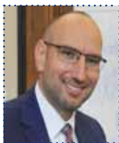
PAWEŁ LISOWSKI starosta słupski

- Strażacy ochotnicy, którzy z poświęceniem ratują życie czy mienie mieszkańców powiatu, muszą być odpowiednio wyposażeni. Dobry sprzęt oznacza większą efektywność. Niestety, nie wszystkie jednostki mogą cieszyć się z takiego sprzętu. Dotyczy to zwłaszcza jednostek spoza Krajowego Systemu Ratowniczo-Gaśniczego, które pozbawione są centralnego, państwowego dofinansowania. Dlatego stworzyliśmy program wspierania ochotniczych straży pożarnych w naszym powiecie. Jestem przekonany, że pieniądze, które na ten cel przeznaczyliśmy, przełożą się na poprawę poziomu bezpieczeństwa mieszkańców.